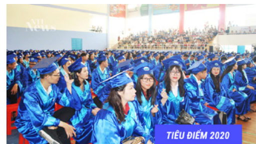
TIÊU ĐIỂM 2020

TUYỂN SINH MỚI 01 CHƯƠNG TRÌNH CHẤT LƯỢNG CAO NGÀNH KẾ TOÁN VÀ 02 CHƯƠNG TRÌNH ĐÀO TẠO TIẾN SĨ