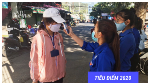
TIÊU ĐIỂM 2020

GÓI HỖ TRỢ TRỊ GIÁ 8 TỶ ĐỒNG DÀNH CHO SINH VIÊN BỊ ẢNH HƯỞNG BỞI DỊCH BỆNH COVID-19