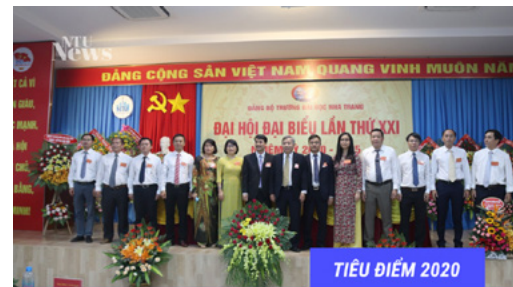
TIÊU ĐIỂM 2020

ĐẠI HỘI ĐẠI BIỂU LẦN THỨ XXI TRƯỜNG ĐH NHA TRANG DIỄN RA THÀNH CÔNG TỐT ĐẸP