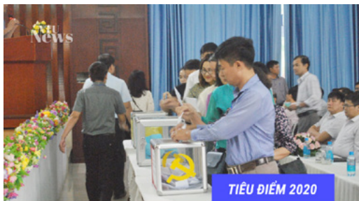
TIÊU ĐIỂM 2020

HỘI ĐỒNG TRƯỜNG TRƯỜNG ĐẠI HỌC NHA TRANG ĐƯỢC THÀNH LẬP VỚI 19 THÀNH VIÊN