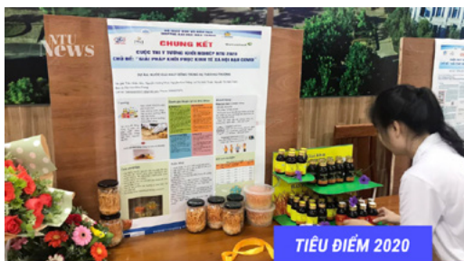
TIÊU ĐIỂM 2020

NHIỀU KHỞI SẮC TỪ CÁC DỰ ÁN KHỞI NGHIỆP SINH VIÊN