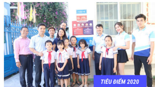
TIÊU ĐIỂM 2020

TRAO TẶNG MÁY RỬA TAY SÁT KHUẨN TỰ ĐỘNG CHO HƠN 80 ĐƠN VỊ Ở KHÁNH HÒA VÀ PHÚ YÊN