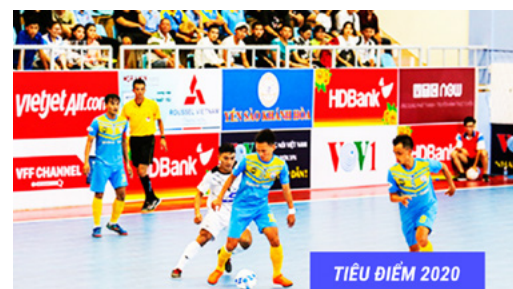
TIÊU ĐIỂM 2020

NHIỀU GIẢI ĐẤU THỂ THAO LỚN NHƯ GIẢI FUTSAL HDBANK VÔ ĐỊCH QUỐC GIA 2020, GIẢI BÓNG ĐÁ TỬ HÙNG, GIẢI BÓNG ĐÁ 7 NGƯỜI...DIỄN RA TẠI TRƯỜNG