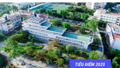
TIÊU ĐIỂM 2020

ĐẦU TƯ, NÂNG CẤP NHIỀU HẠNG MỤC CƠ SỞ VẬT CHẤT NHẪM PHỤC VỤ TỐT HƠN NỬA CÁC HOẠT ĐỘNG CỦA NHÀ TRƯỜNG