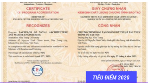
TIÊU ĐIỂM 2020

NGÀNH KỸ THUẬT TÀU THỦY VÀ CÔNG NGHỆ CHẾ BIẾN THỦY SẢN ĐẠT CHUẨN KIỂM ĐỊNH CHẤT LƯỢNG GIÁO DỤC