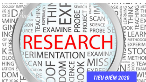
TIÊU ĐIỂM 2020

83 BÀI BÁO KHOA HỌC ĐƯỢC CÔNG BỐ TRÊN CÁC TẬP SAN QUỐC TẾ Ở NHIỀU LĨNH VỰC.